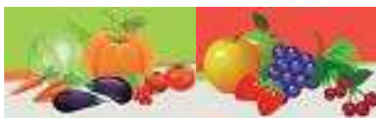
LES AMAP, GROUPES, PAYSANNES ET PAYSANS

Pour finir cet édit, la vidéo JEUNE ET FAUCHÉ : comment bien s'alimenter de « Partager c'est Sympa » est à retrouver (et à diffuser !) sur le site des AMAP d'Auvergne-Rhône-Alpes !